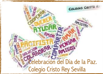
Celebración del Día de la Paz. Colegio Cristo Rey Sevilla

Con la participación en CAMPAÑAS y JORNADAS INTERNACIONALES , despertamos en los corazones de nuestros alumnos la sensibilidad, la empatía y la solidaridad para que buscando el bien se comprometen en la transformación de la realidad en la que viven desde los valores del Reino.