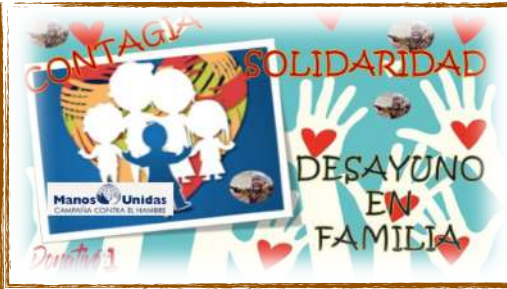
Campaña de Manos Unidas 2021. Colegio Cristo Rey Santa Úrsula

¡Que cada paso que demos, sea de JUSTICIA, VERDAD y LIBERTAD . ¡Qué hoy y siempre vivamos por la PAZ!