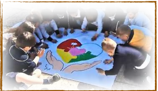
Día mundial de la concienciación sobre el autismo. Colegio Cristo Rey - Las Rozas Todos con las mismas oportunidades

¡Contagia solidaridad y el bien multiplicarás!